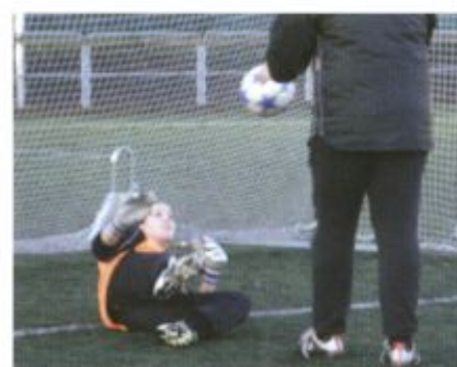
Bilder från tidigare Showcase